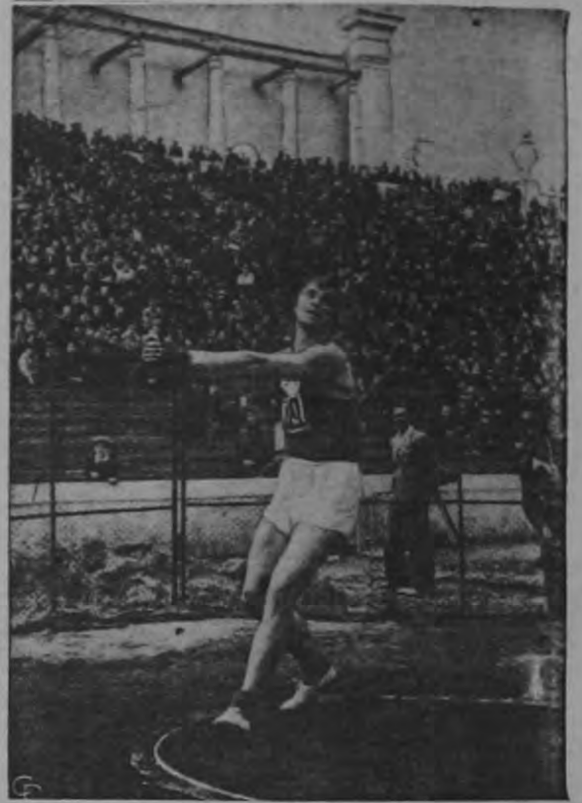
M. G. Krovandsov, orgullo del equipo de campo y pista soviético, lanza el martillo estableciendo una nueva marca mundial de distancia de 66 metros y 33 centímetros (aproximadamente 217 pies) en una competencia en Minsk, Rusia. (INP).