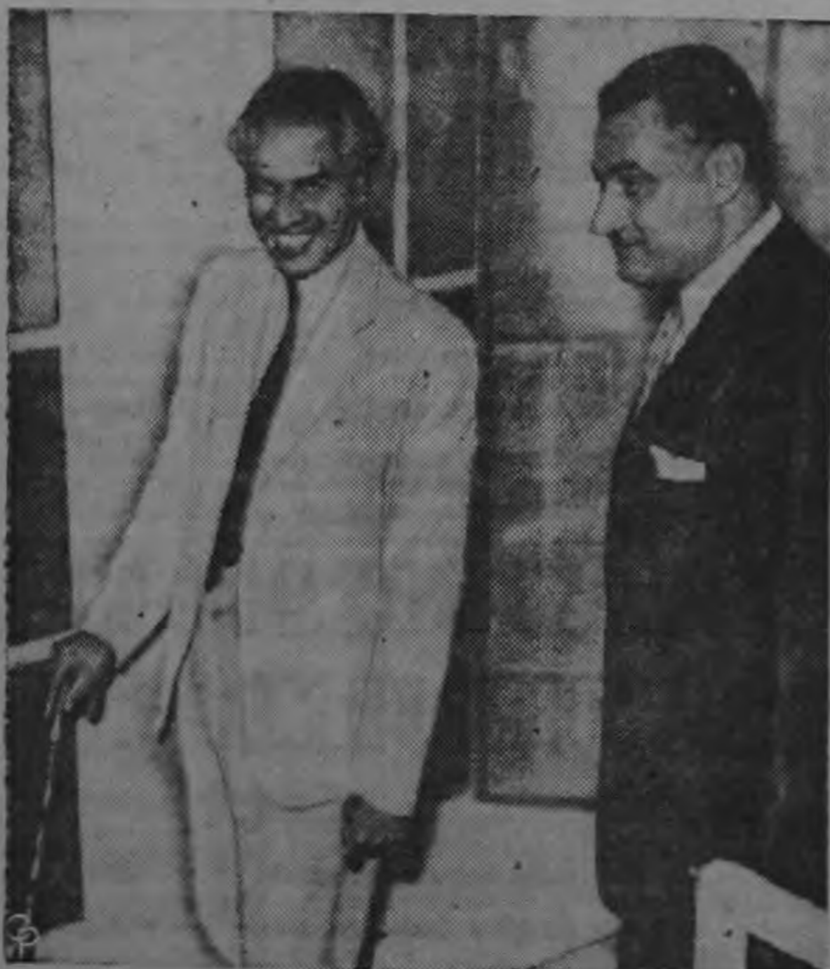
El Embajador de la India V. K. Krishna Menon y el Presidente egipcio Gamal A. el Nasser (derecha) retratados en Cairo después de estudiar todos los aspectos de la crisis del canal de Suez. Trataron de buscar los puntos de posible ajuste entre los planes de Dulles y de la India para fijar el status del canal.