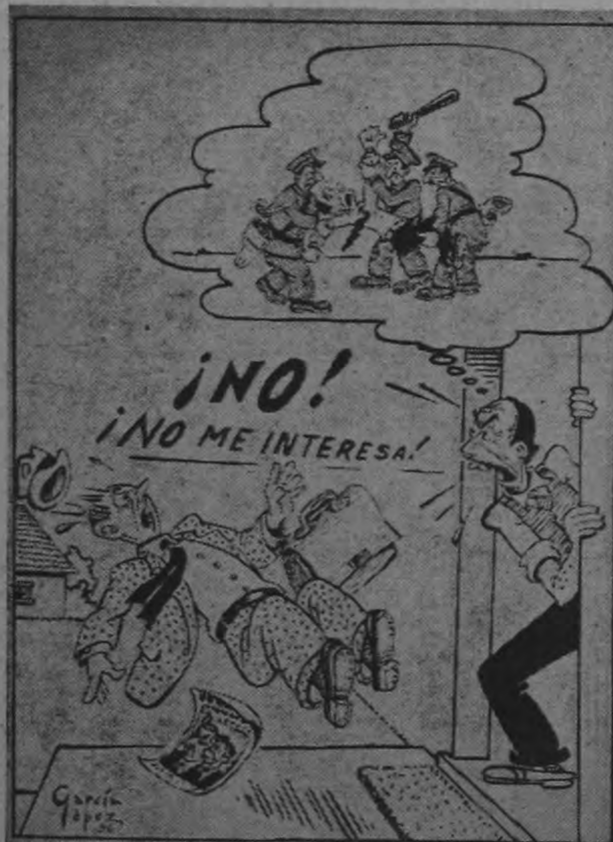
HAY COSAS QUE NO SE PUEDEN OLVIDAR