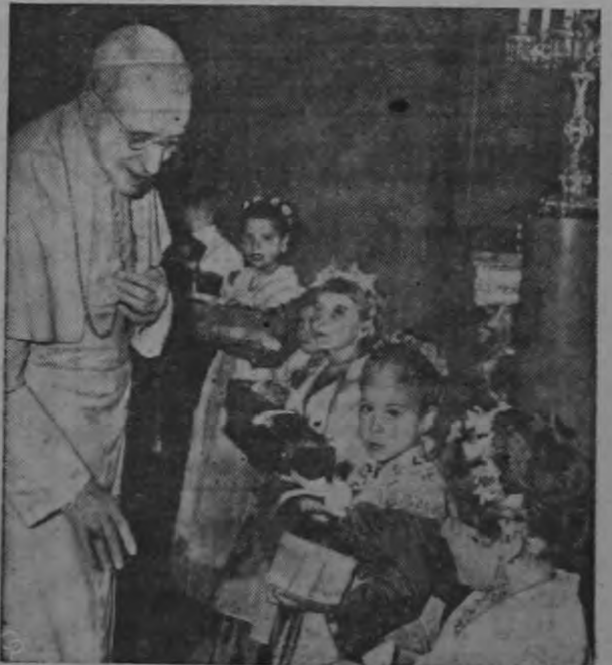
Vistiendo trajes regionales estas niñas obsequian al Papa Pío XII cestas de melocotones en su residencia de verano en Castelgandolfo, Italia. Las frutas fueron las premiadas en el 21 festival anual del Melocotón en Castelgandolfo.

Recorte esta postal y péguela en el ALBUM de CURIOSIDADES! ASI ES LA NATURALEZA