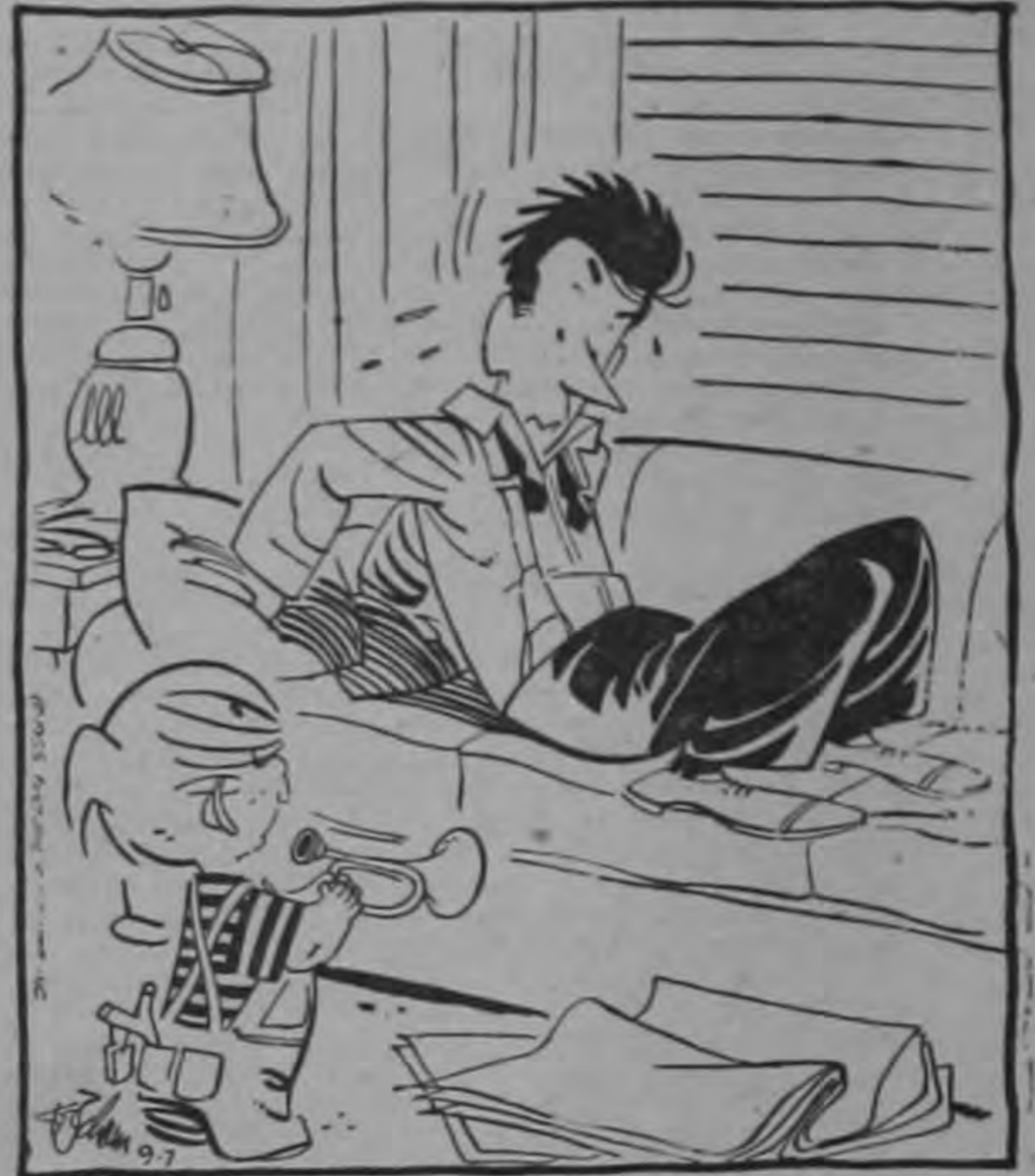
Así es como despiertan a los soldados en el ejército